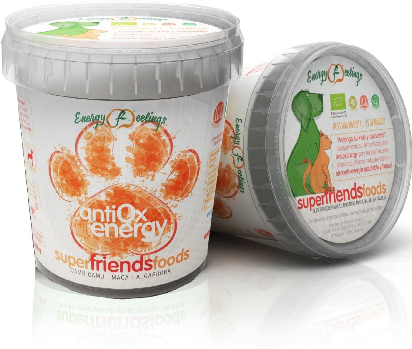
(500 gr) Cubo